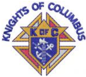
Knights of Columbus

2003年10月：卑詩省 ( British Columbia ) 實行同性婚姻合法化三個月後，一對女同性戀伴侶針對一個羅馬天主教男性組織提出了一項人權訴訟，理由是該組織拒絕她們租用場地舉行同性「婚禮」。卑詩省的人權審裁處要求哥倫布騎士會向該對伴侶賠償2,000元，理由是該會傷害了她們的「尊嚴、感受和自尊」。這個判決賦予同性戀者一項新發明的特別權利：不能得罪的權利，那是一般加拿大人所沒有的。向宗教自由說再見吧，騎士們！