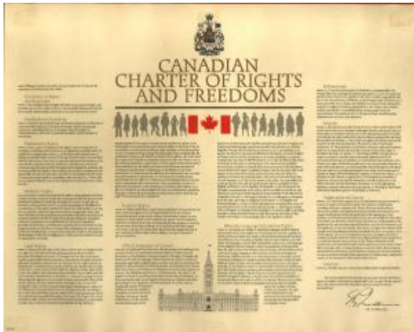
Canadian Charter of Rights and Freedoms (網絡圖片)

2004年9月16日：一名本身是活躍分子的法官，把曼尼托巴省 ( Manitoba ) 的同性婚姻合法化，當局同一天便發信給該省全部600名婚姻註冊官，通知他們必須為同性戀伴侶主持有關儀式，否則便得交出執照。此舉顯然侵犯了他們在宗教自由和良知方面的人權，這些人權正是受加拿大《權利與自由憲章》保障的。